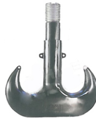
Lifting Double Hook Dimensions Table